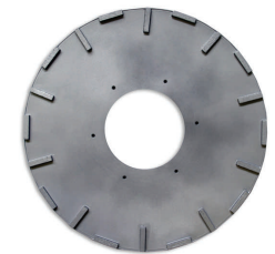
ARAMIS, SORMA JA WETROK