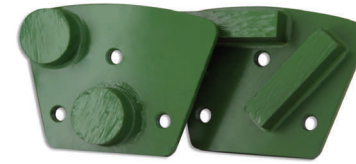
DIANOVA (esim. HTC)

Hiomalaikan kulutuskestävyyden lisääminen vaikuttaa suoraan hiontanopeuteen. Nyökkisääntönä on, että hiomasegmentit pehmeälle betonille ovat kovat ja kovalle betonille pehmeät.