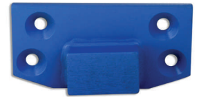
M & B